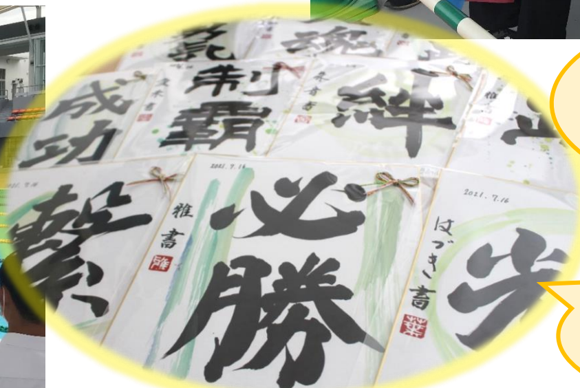
選手に贈った色紙