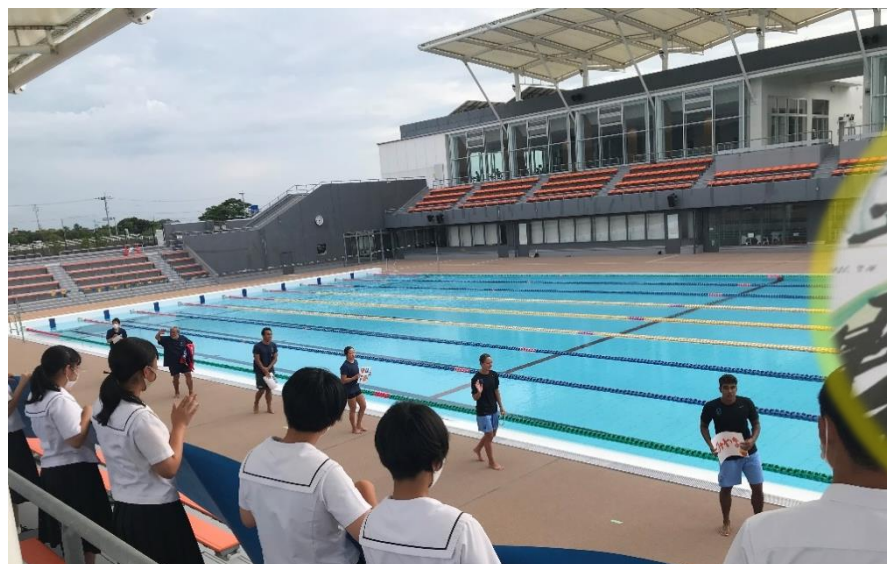
横断幕を持って選手を応援する書道部・生徒会